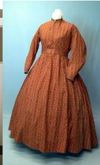
gauni la calico

https://answersforadventists.wordpress.com/resources/articles-2/womens-pants-dress-reform/