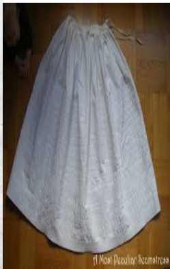
American costume na Corded Skirt